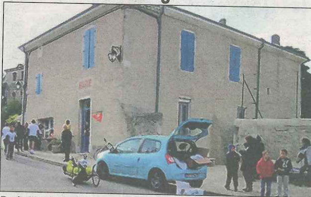
Ravitaillement devant la mairie.

La 6e course du cœur, organisée par l'association « Sauvegarde de l'enfance et de l'adolescence de la Drôme » faisait escale à La Touche.